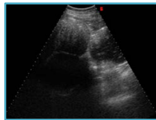
Echo van een paard met koliek.

Je paard mag niet dadelijk opnieuw beginnen te eten als hij zich beter voelt. Het is beter dat de darmen zich eerst ledigen gedurende één nacht, voordat je paard opnieuw gevoerd wordt. Na de behandeling geef je jouw paard het liefst laxatief voer (gras, mash...).